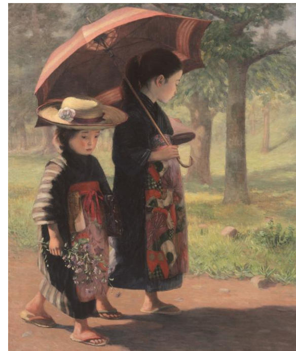
児島虎次郎《登校》1907年 高梁市成羽美術館蔵